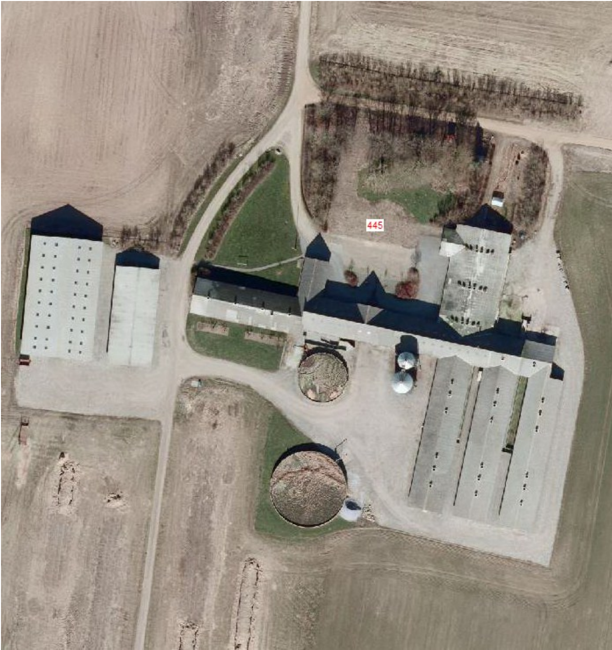
Bilag 1. Nuværende stalde og siloer, Holstebrovej 445, Hvidbjerg, 7860 Spøttrup