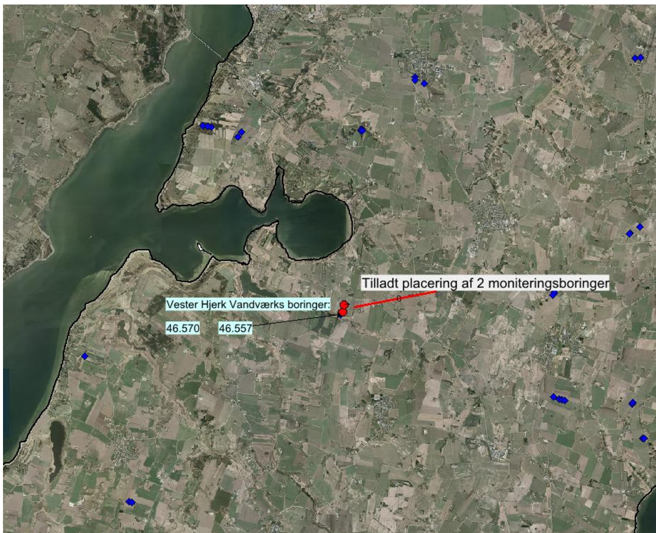
Oversigtskort side 2